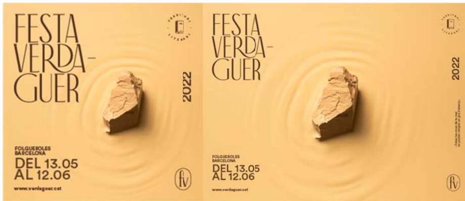
Catorze (300 x 250px)