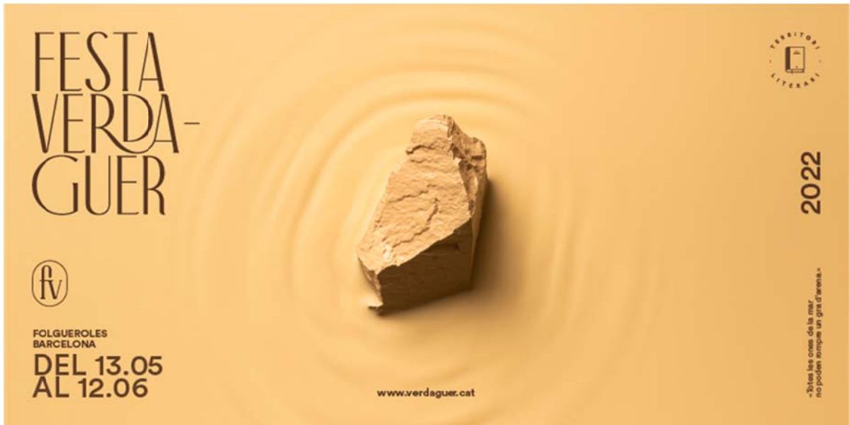
Vilaweb (300 x 300px, 800 x 600 px)