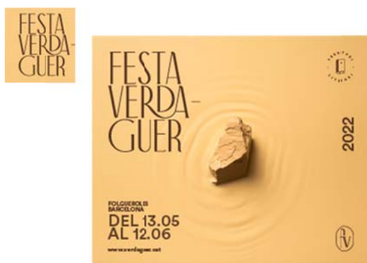
Osona.com (800 x 400px / 320 x 400px, 970 x 90px, 300 x 250px)