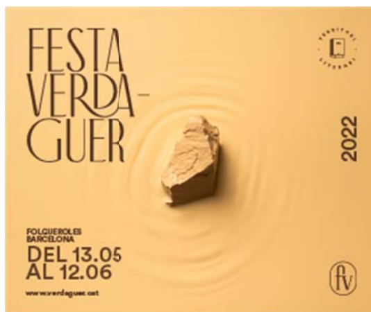
FestaCatalunya.cat (1005 x 390px, 300 x 600 px)