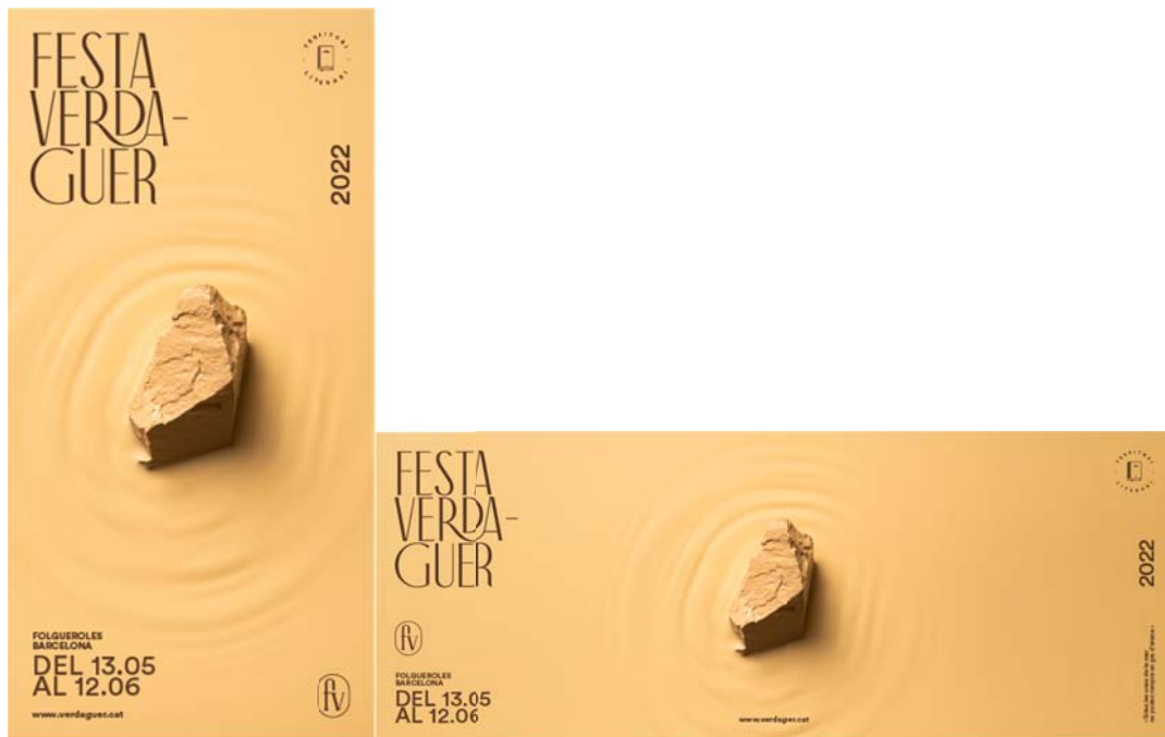
Núvol (300 x 300px, 1000 x 100px)